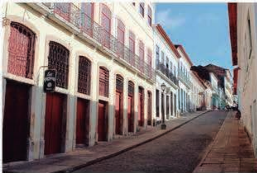
Centro Histórico concentra um dos maiores acervos arquitetônicos do país

São Luís é a única capital brasileira fundada por franceses e, principal-