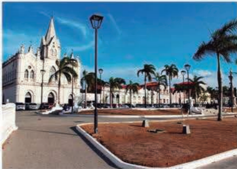
Da Praça Gonçalves Dias, tem-se uma vista deslumbrante da cidade

mente, devido ao rico acervo arquitetônico recebeu, em dezembro de 1997, o título de "Cidade Patrimônio da Humanidade". São mais de 3.000 prédios coloniais, na região conhecida como "Centro Histórico" e que ocupa uma área maior que 200 hectares. Com muitos sobradões com fachadas de azulejos portugueses, sacadas trabalhadas em ferro e madeira, telhados e mirantes, o lugar, enche de nostalgia todos os visitantes, que passam pelo local. É impossível não se encantar com cada pedacinho de chão colocado majestosamente, pelas mãos do grande arquiteto do universo. Suas ruas, becos, ladeiras e suas belas praias de água morna e cor verde-turquesa fazem da capital maranhense uma das mais belas cidades do Brasil. Isso, sem falar das cores, ritmos e da diversidade cultural que ecoa nessa ilha magnética, de gente simples e acolhedora. Fundada por franceses em 1612, invadida por holandeses pouco tempo depois, São Luís foi finalmente colonizada por portugueses, que deixaram aqui marcante influência. Mas a pacata São Luís ficou pra trás. Grandes empresas, indústrias, projetos e empreendimentos surgem a cada ano.