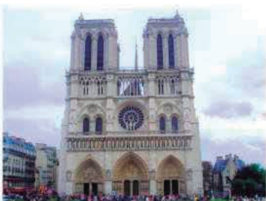
A Catedral de Notre Dame tem fachada imponente

Descendo um pouco mais a Avenida Champs-Élysées, logo no início do passeio, o visitante pode conhecer também outro local super famoso, o Arco do Triunfo, que foi encomendado por Napoleão Bonaparte para celebrar as conquistas e vitórias do seu império. Um percurso que pode ser feito também de metrô (Charles de Gaulle-Etoile). Mas, o turista que optar caminhar, se surpreende com as belezas de Paris. Uma verdadeira maravilha.