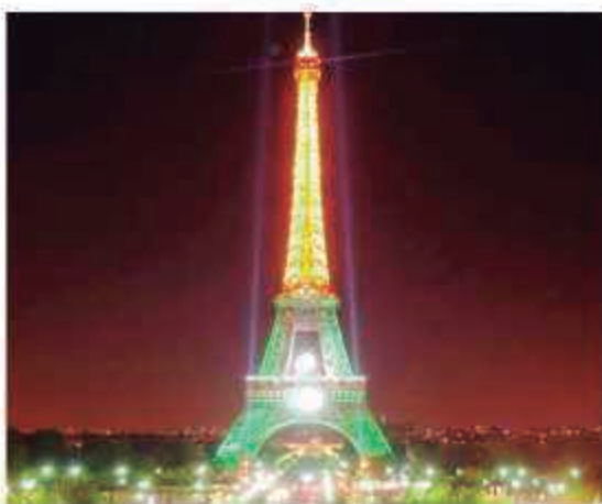
A Torre Eiffel é um dos locais mais visitados da França

A Avenida Champs-Élysées, uma das principais da capital francesa, é o melhor ponto de partida para os principais passeios e também tornou-se parada obrigatória para quem visita Paris. Essa famosa avenida, que é uma das mais largas do planeta, vive sempre cheia de turistas de várias partes do mundo. A tradição significa, Campos Elíseos.