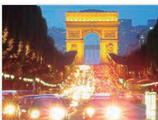
A Avenida Champs Elysees é sempre cheia de turistas

Triunfo, o Palácio de Versailles, etc. Estão incluídos também nesse roteiro, uma visita ao Musée de la Mode, Opera Garnier, cruzeiro pelo Rio Sena, além de descontos em restaurantes e lojas como Galeries Lafayette e outros estabelecimentos.