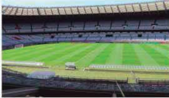
O belo Estádio do Mineirão tornou-se ponto de visitação

A capital mineira, que é toda emoldurada naturalmente, pela