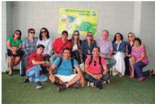
Jornalistas do MA e MG acompanham a Feijoada em BH e São Luís