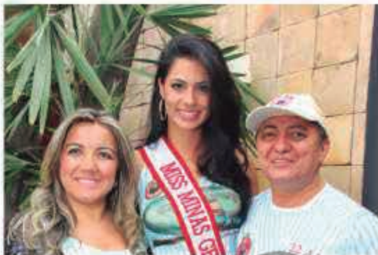
Até a Miss Minas Gerais 2013 participou da feijoada