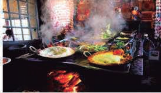
O Restaurante Vila Rural serve a típica comida mineira