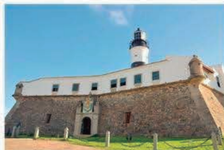
O Farol da Barra é o principal cartão postal de Salvador

fica numa região conhecida como "Litoral Norte" e atrai milhares de turistas, que buscam principalmente, as belas e tranquilas praias. O local se transformou no maior complexo turístico do Brasil e possui estrutura de hotéis, resorts e restaurantes únicos no Brasil. Absolutamente, fascinante.