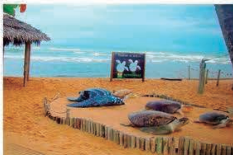
A Praia de Forte tem área de preservação marítima